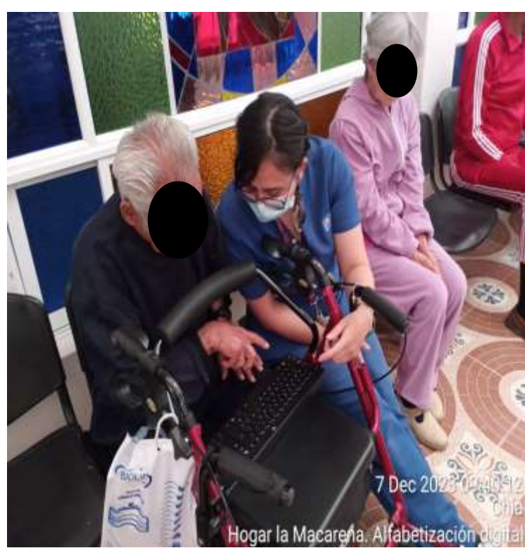
7 Dec 2023 09:45:12 Chía Hogar la Macarena. Alfabetización digital