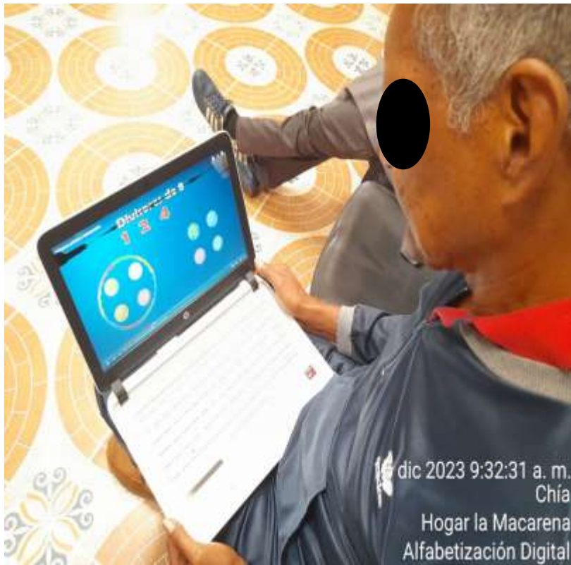
dic 2023 9:32:31 a. m. Chía Hogar la Macarena Alfabetización Digital