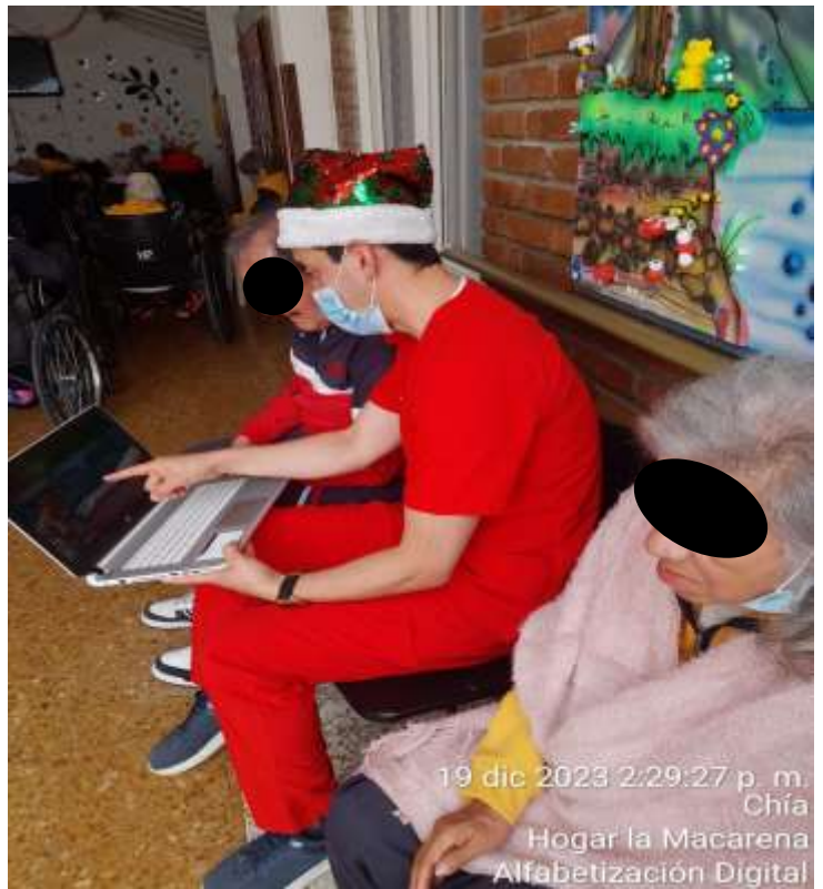
19 dic 2023 2:29:27 p. m. Chía Hogar la Macarena Alfabetización Digital