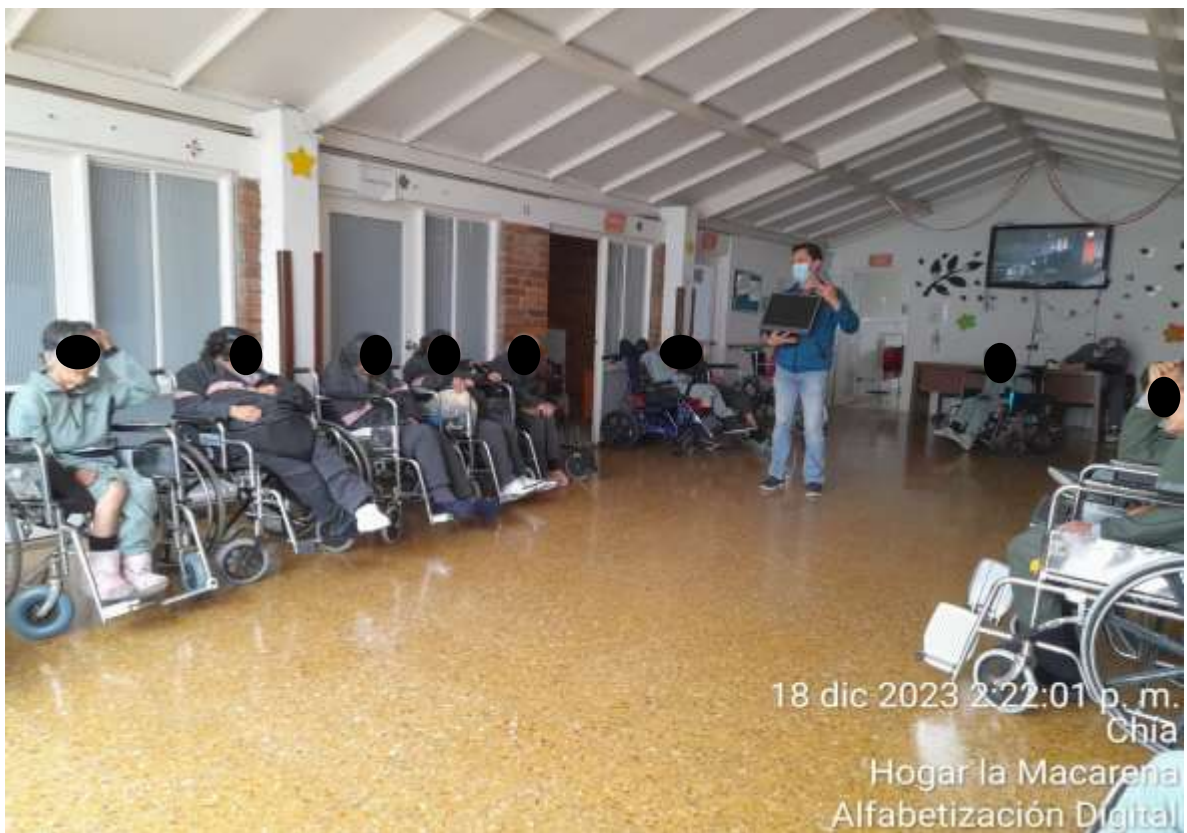
18 dic 2023 2:22:01 p. m. Chía Hogar la Macarena Alfabetización Digital