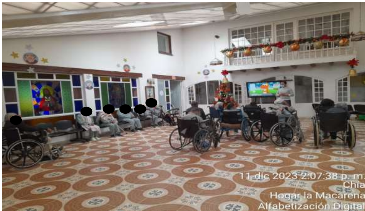
11 dic 2023 2:07:38 p. m. Chía Hogar la Macarena Alfabetización Digital