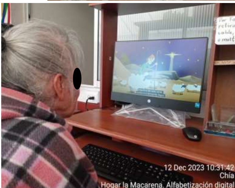
12 Dec 2023 10:31:42 Chía Hogar la Macarena. Alfabetización digital