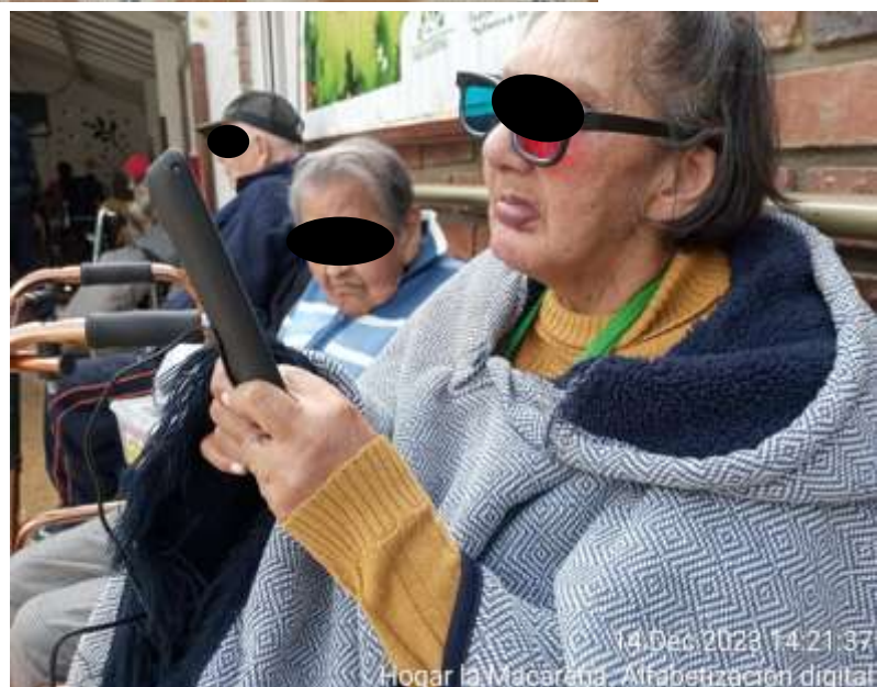
14 Dec 2023 14:21:37 Hogar la Macarena. Alfabetización digital